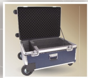
Case para Equipamento

Fecho borboleta Carrinho embutido e pneu 5"