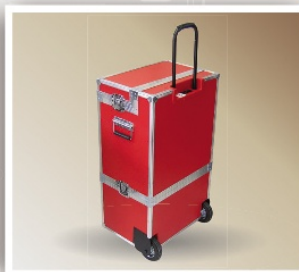
Case Duplo para Ferramentas

Sistema de empilhamento Suporte para monitor LCD