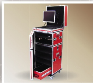
Case para Artroscopia

Fecho engate nylon Carrinho embutido e sistema de empilhamento