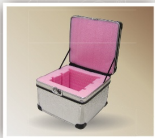
Case com espuma Anti Estática