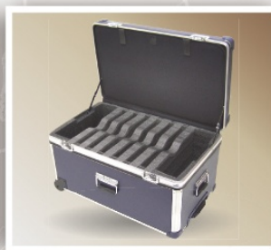
Case para Notebook