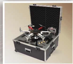
Case para Drone

Fecho borboleta Carrinho embutido e Pneu 5"