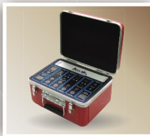
Case para Automação