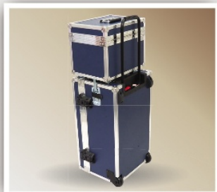
Case com Empilhamento

Fecho engate nylon Carrinho embutido e sistema de empilhamento